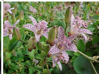
Lis crapaud Semences non traitées