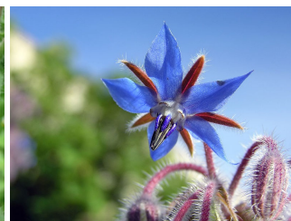
Borago officinalis Semences non traitées