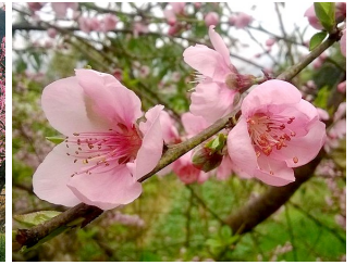
Pêcher Semences non traitées