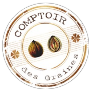
Achillée Millefeuille Reine cerise Semences non traitées