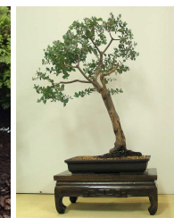
Gommier Semences non traitées